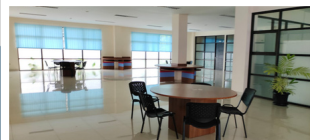
Ruang Belajar Bersama